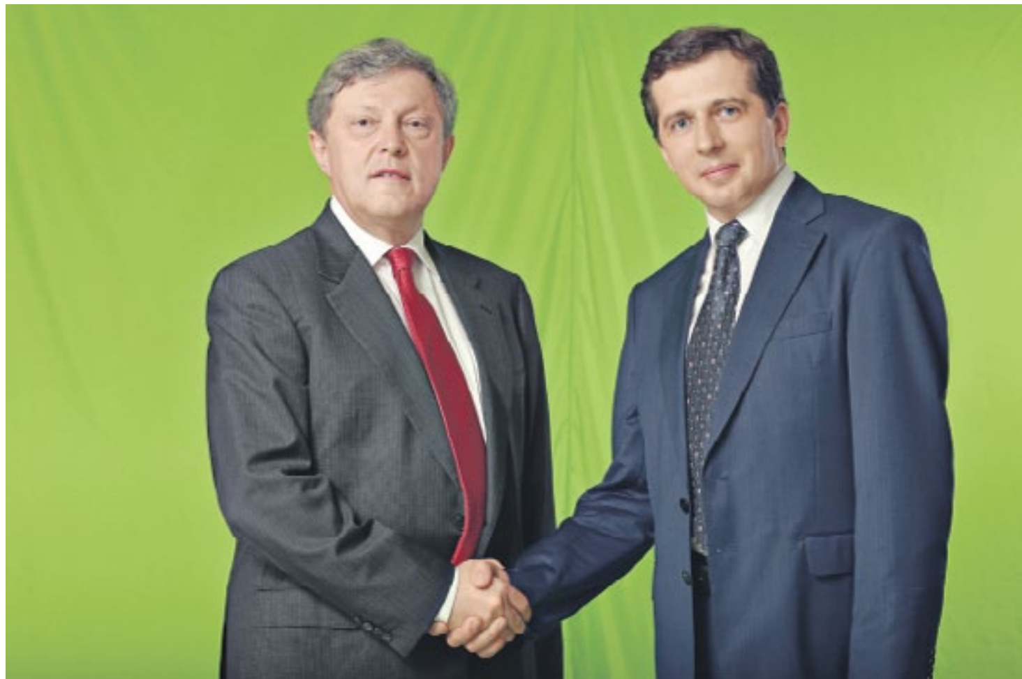
Григорий Явлинский со своим политическим советником Сергеем Григоровым (кандидатом в депутата Мосгордумы)

4. Стагфляция разрушает экономику очень глубоко: невозможно ничего планировать, инвестиции стремятся к нулю, все пытаются решать только мелкие сиюминутные задачи. Например, ищут деньги на Крым – отбирают пенсионные накопления и повышают налоги. Деньги для отправки в Крым (будет ли от них там польза – это еще отдельный вопрос) найдут, но навсегда